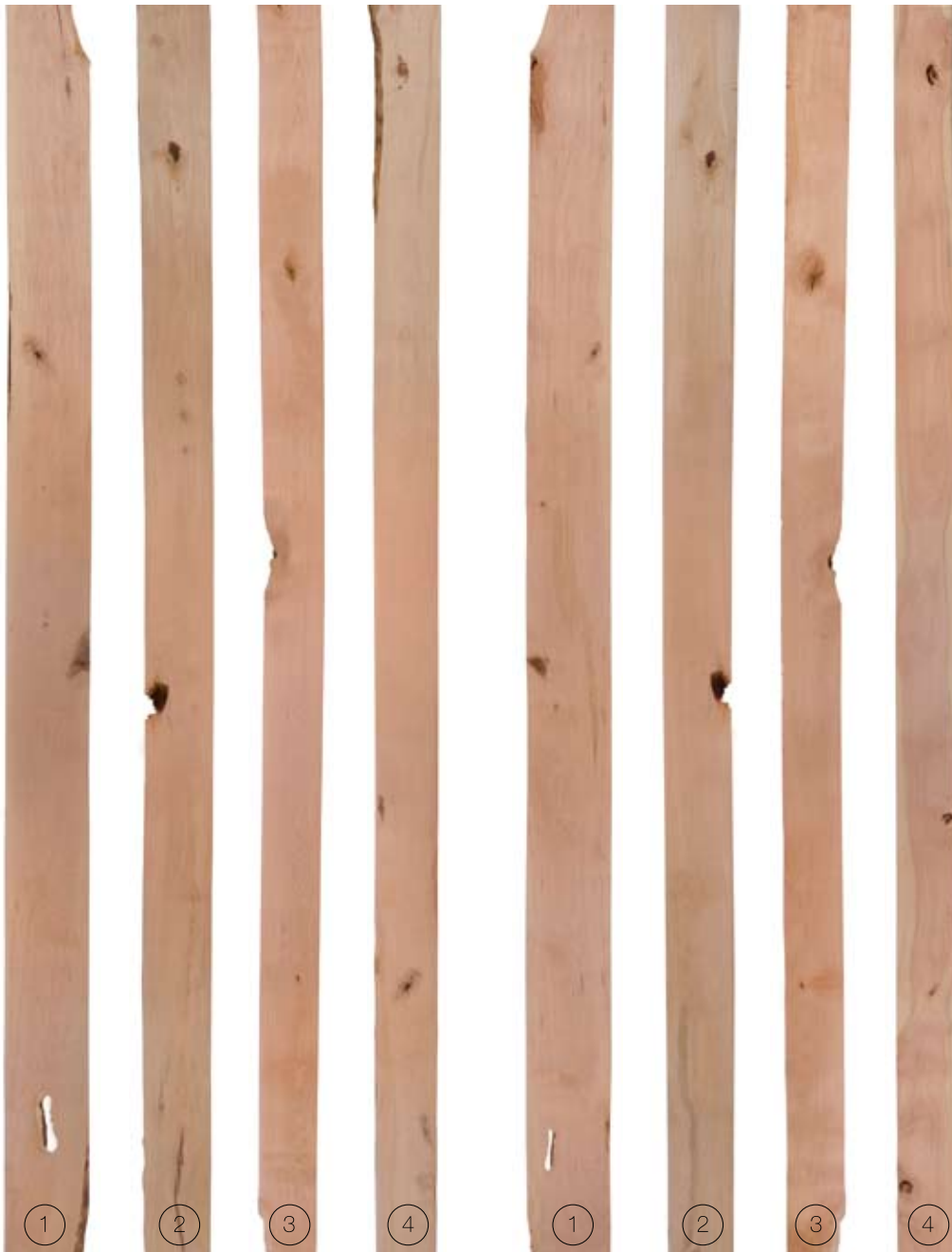
FRONT FACE | CARA FRONTAL

Rendimiento de superficie limpia is 50% - 67% por ambas caras.