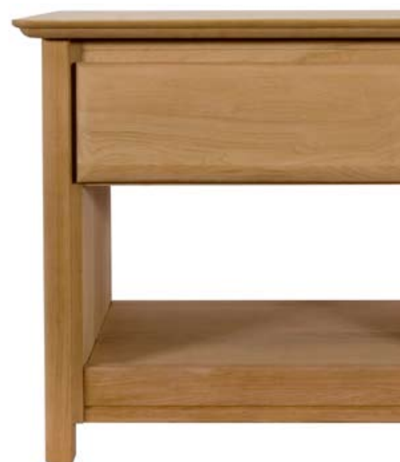
BACK FACE | CARA TRASERA