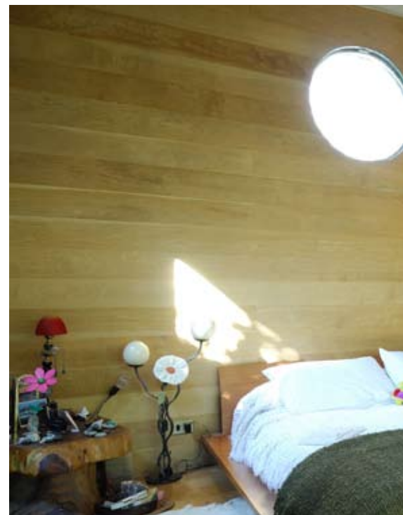
BACK FACE | CARA TRASERA