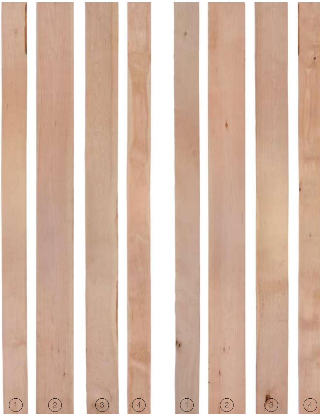
FRONT FACE | CARA FRONTAL

Rendimiento de superficie limpia es: Cara Frontal 83% - 100%. Cara Posterior 67% - 100%.