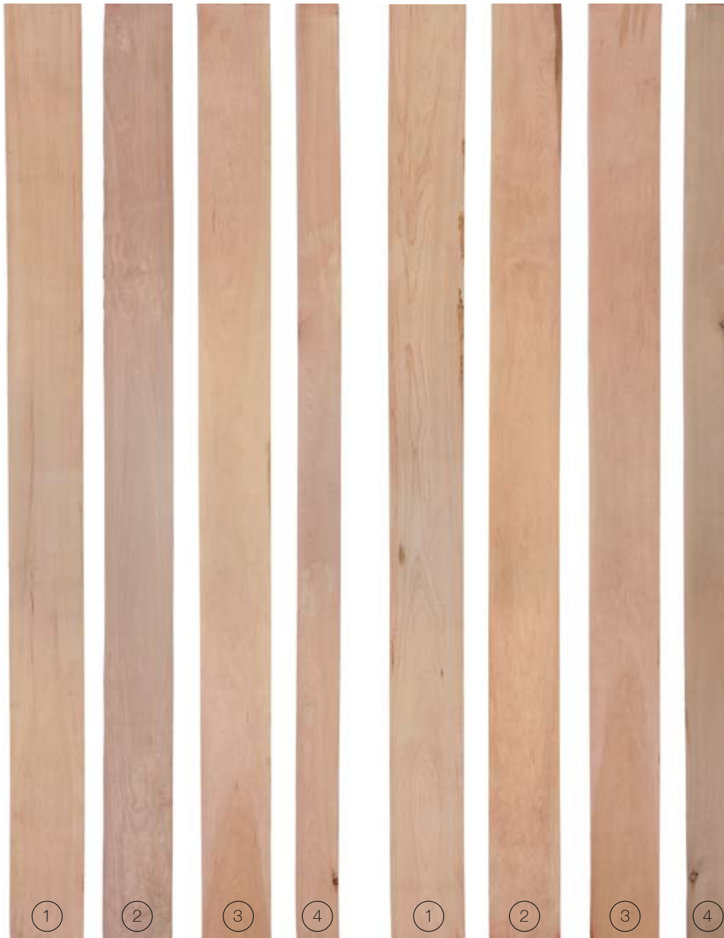
FRONT FACE | CARA FRONTAL

Rendimiento de superficie limpia es 83% - 100% por ambas caras.